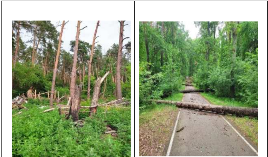
Рис. 1. Пошкодження дерев Pinus silvestris L. внаслідок обстрілів (ліворуч) і використання дерев під час створення перешкод для руху (праворуч)

Детальне обстеження екосистем проведено здебільшого в господарській частині парку, яка зазнала значних пошкоджень внаслідок обстрілів і окупації. Частково наслідки бойових дій зафіксовані і на території НПП, де відмічені рідкісні види рослин та тварин (рис. 2), зокрема частково або повністю знищено фрагменти верхнього ярусу деревостану соснових лісів.