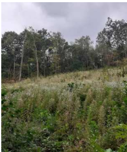
Рис. 4. Загальний вигляд вирубки на ділянці 1 відразу після вирубки (ліворуч) та у другій половині вегетації (праворуч)

Наприкінці вегетації вирубка рясно заросла трав'яними рослинами (рис. 4), зокрема аспект створювали види адвентивних рослин: Erigeron annuus (20%) і E. canadensis L. (20%) заввишки до 1,3 м, відмічено Ambrosia artemisiifolia . Значну роль у формуванні трав'яного ярусу мав також Galeopsis bifida (15%). Серед інших рудеральних рослин зафіксовано