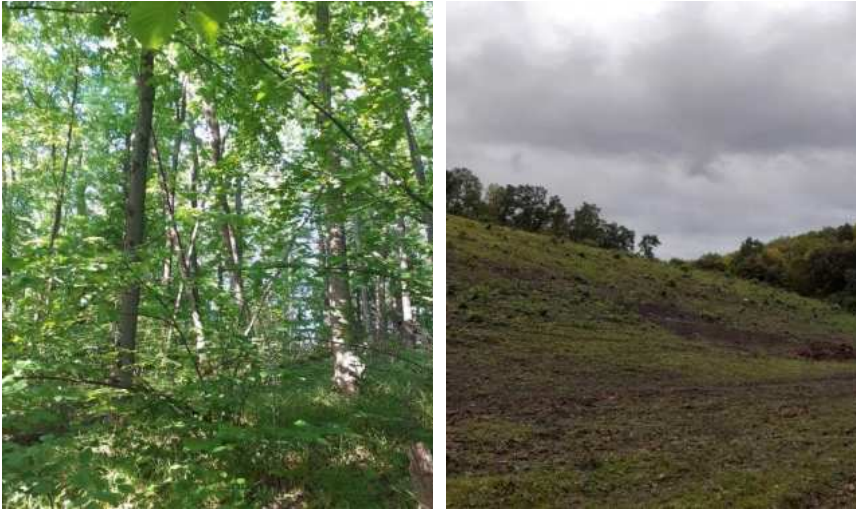
Рис. 7. Загальний вигляд вирубки на ділянці 4 до (ліворуч) і після (праворуч) вирубки (фото С. Панченка, 2020 р.)

до повного знищення рослинного покриву не призводять – доволі високе проективне покриття трав'яного ярусу залишається.