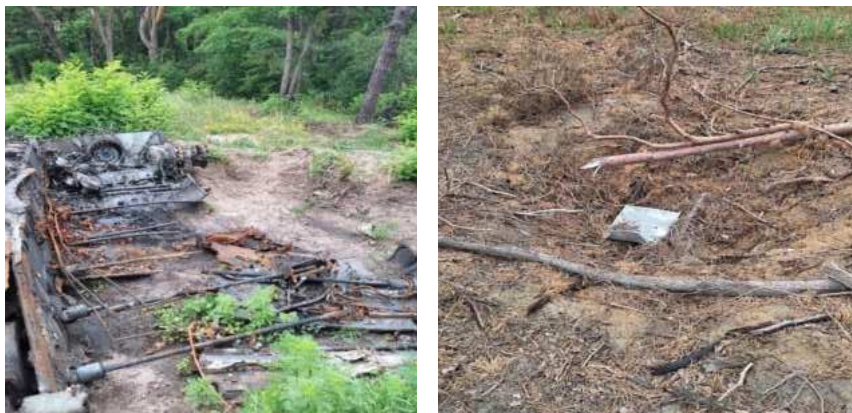
Рис. 3. Вирви після обстрілів: заростання Ambrosia artemisiifolia L. і Robinia pseudoacacia L. місця із пошкодженою технікою – (ліворуч), із повністю знищеним пожежею трав'яним покривом (праворуч) (фото В. Смаголь, 2022 р.)

вирвах завглибшки 0,5-1 м рослинний покрив відсутній, ознак заростання не виявлено (не зафіксовано навіть однорічників). Ймовірно, це пов'язано зі ступенем ушкоджень ґрунтового і рослинного покриву внаслідок термічного впливу вибуху та з відсутністю банку насіння видів адвентивних рослин у ґрунті.