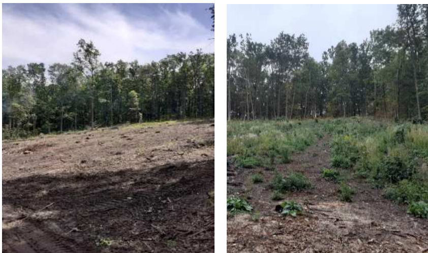
Рис. 5. Загальний вигляд вирубки на ділянці 2 відразу після вирубки (ліворуч) і в другій половині вегетації (праворуч)

(3-5%). Значну участь у формуванні надґрунтового покриву має Rubra holostea (3-5%). Трапляються також Lathyrus vernus , Moehringia trinervia (L.) Clairv., Geum urbanum L., Pulmonaria obscura Dumort., Fallopia dumetorum . Відмічені весняні ефемероїди, які завершили вегетацію: Adoxa moschatellina L., Anemonoides ranunculoides (L.) Holub ( Anemone ranunculoides L.).