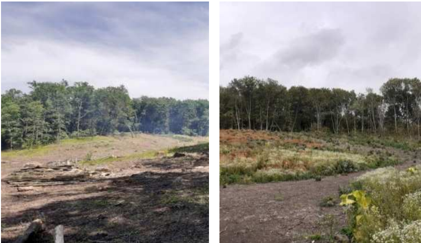
Рис. 6. Загальний вигляд ділянки 3 відразу після вирубки (ліворуч) і в другій половині вегетації (праворуч)

Деревостан із зімкнутістю крон 0,85 заввишки до 24-26 м. Верхній під'ярус деревостану сформований Quercus robur (0,2-0,3) і Fraxinus excelsior (0,3-0,4). Нижче під'ярус із клена гостролистого Acer platanoides (0,2-0,3), Tilia cordata (0,1-0,2) та Ulmus glabra (0,1-0,2), окремі рослини яких сягають висоти першого під'ярусу. Підлісок сформований здебільшого за рахунок великого підросту Ulmus glabra (0,05-0,10) та Acer platanoides (0,10-0,15) за участю Euonymus europaeus (0,05). У цьому ярусі також відмічено Sambucus nigra , Euonymus verrucosus , Crataegus rhipidophylla Gand. ( C. curvisepala Lindm.), Corylus avellana . У трав'яному ярусі загальним проєктивним покриттям 35% домінують Aegopodium podagraria (10%), Alliaria petiolata (5-10%), Rabelera holostea (5-10%). Трапляються також Cardamine impatiens L., Urtica dioica L., Galium aparine L., Polygonatum multiflorum , Asarum europaeum L., Poa nemoralis L.